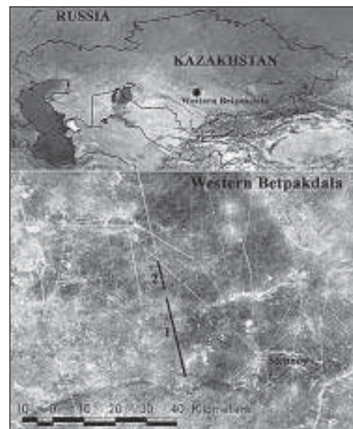
Рис. 1. Район работ

Из-за своеобразных ПЗУ на обследованных участках ЛЭП отмечен очень высокий