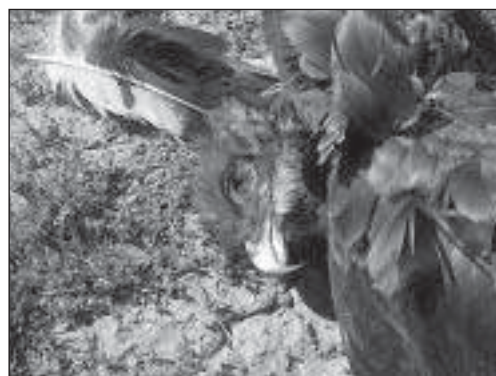
Змеяяд ( Circaetus gallicus ), погибший от поражения электротоком.

Угловые опоры обследованной птицеподопасной ЛЭП и ближайшие к ней опоры безопасных для птиц ЛЭП привлекательны для устройства гнёзд хищными птицами, однако, несмотря на это, нами не обнаружено ни одного гнезда хищных птиц, как на этих ЛЭП, так и в радиусе 3 км от