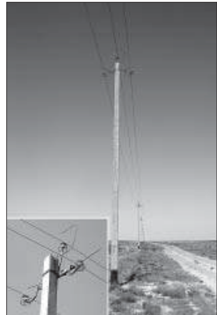
Рис. 3. Птицеопасная ЛЭП. Тип 2.