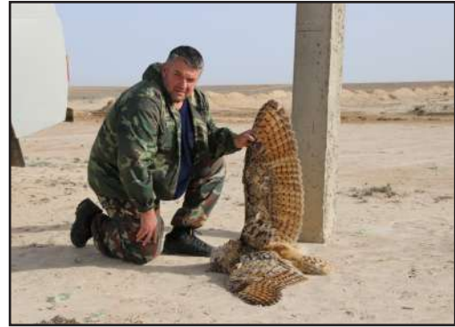
Филин ( Bubo bubo ), погибший на опоре ВЛЭ катодной защиты трубопровода АО «КазТрансГаз». Весна 2015 г.

В ходе реализации проекта мы дважды (в октябре 2014 г. и в апреле 2015 г.) провели учет погибших птиц на ВЛЭ средней мощности на территории Мангистауской области. Всего было обследовано 440 км ВЛЭ катодной защиты, принадлежащих государственным компаниям АО «КазТрансГаз» (250 км) и АО