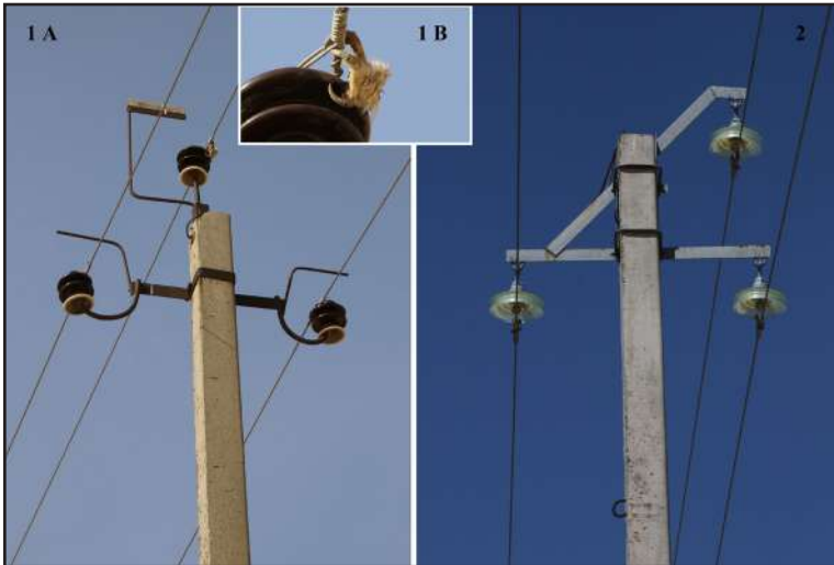
Рис. 2. Траверса ВЛЭ АО «КазТрансГаз» со штыревыми изоляторами – наиболее распространённый и опасный для птиц вариант конструкции – 1А. На верхнем проводе видна лапа филина ( Bubo bubo ), погибшего от поражения электрическим током – 1В. Опоры ВЛЭ АО «КазТрансОйл», оборудованные траверсами «ласточкин хвост» с подвесными тарельчатыми изоляторами, также опасны для крупных хищных птиц и нуждаются в дооборудовании ПЗУ – 2.

Fig. 2. 1A: The cross-arm of the middle-voltage power line with pin-type insulators owned by “KazTransGas” corporation. The power line with pin-type insulators is the most common, but the most bird-hazardous type of power line construction. 1B: A foot of an Eagle Owl ( Bubo bubo ) died from electrocution hanging from the upper wire is visible on the photo. 2: Pylons of a middle-voltage power line equipped with “swallow-tail”-type cross-arms with suspended cap-and-pin insulators owned by “KazTransOil”. Power lines of this construction are also dangerous for a large Birds of Prey and must be modified with a bird protective devices.