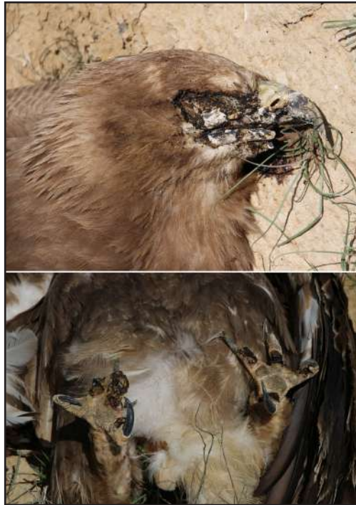
Fig. 3. Charred feet and head of a Steppe Eagle ( Aquila nipalensis ) killed at a power pole owned by JSC KazTransOil: these burn marks are typical for large birds electrocuted at structures with metal dovetailed crossbars.

ными лапами и головой (рис. 3). Данные повреждения были получены в результате короткого замыкания птицами, севшими на нижнюю горизонтальную составляющую траверсы и коснувшихся верхнего токонесущего провода головой. Очевидно, что и траверсы «ласточкин хвост» в сочетании с оголенным токонесущим проводом должны быть оборудованы современными эффективными ПЗУ.