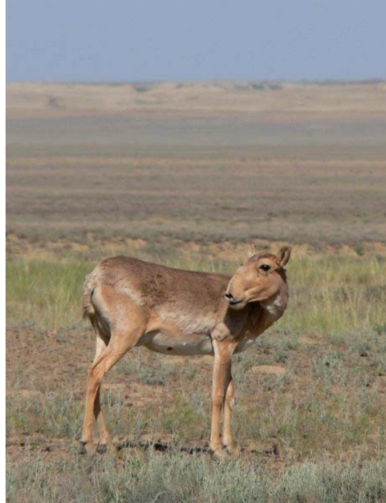
Самка сайгака во время окота в Бетпакдале.

Природоохранная инициатива Алтын-Дала (ADCI) является крупномасштабным проектом по сохранению северных степных и полупустынных экосистем и их ключевых обитателей, находящихся в критическом состоянии, таких как сайгак ( Saiga tatarica tatarica ) или кречетка ( Vanellus gregarius ). ADCI выполняется Правительством Казахстана, Ассоциацией сохранения биоразнообразия Казахстана (АСБК), Франкфуртским зоологическим обществом (FZS),