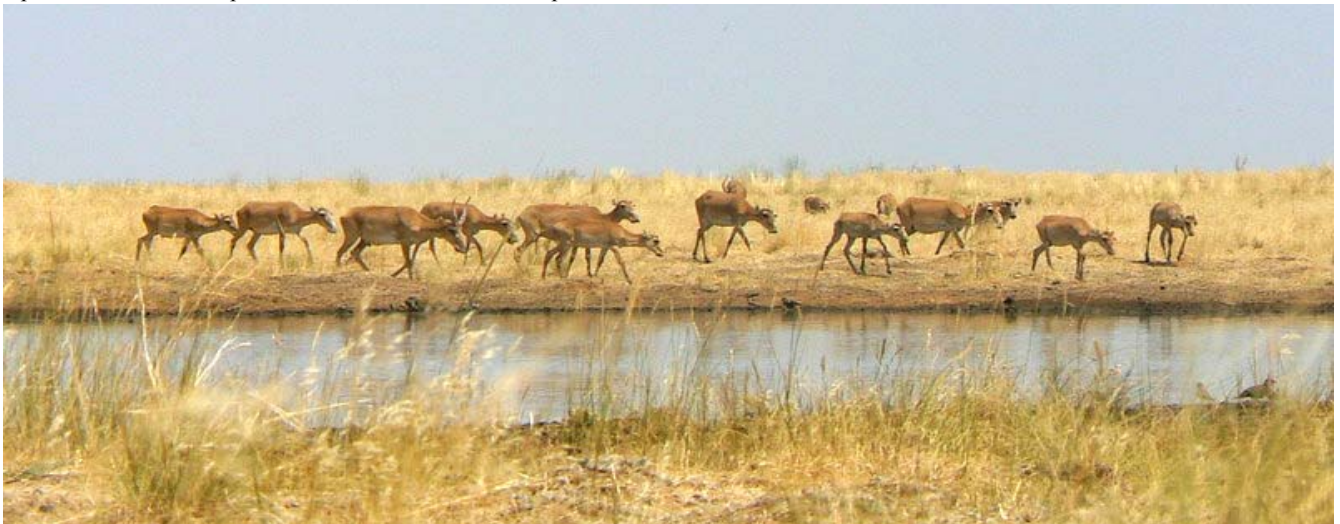
Сайгаки в заказнике «Степной», Россия.

Вы можете получить больше информации и форму заявки на сайте www.saiga-conservation.com или по электронной почте esipov@sarkor.uz и saigaconservationalliance@yahoo.co.uk . Последний срок подачи заявки 30 сентября 2008 г. Продолжительность проекта 1 год, начиная с 15 ноября 2008 г.