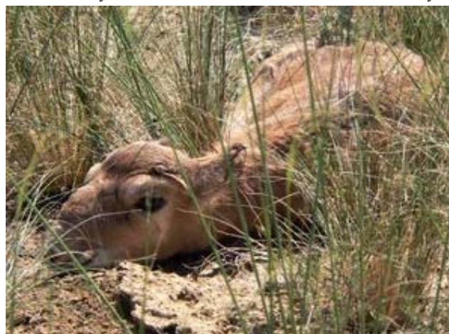
Новорожденный сайгаченок в Бетпакадале, весна 2008 г.

Для эффективного выполнения MoB необходимы двухсторонние соглашения между Казахстаном, Российской Федерацией, Узбекистаном и Туркменистаном. В мае 2007 года Министром сельского хозяйства РК от имени Правительства Казахстана уже подписано аналогичное соглашение с Правительством Туркменистана. Особенно остро стоит проблема с мигрирующей в Узбекистан устьуртской популяцией, которая требует проведения совместных мероприятий по охране и учету сайгака. В этой связи, Комитетом подготовлен проект двухстороннего Межправительственного соглашения по сохранению сайгаков устьуртской популяции; аналогичное соглашение подготовлено для совместных с Россией действий по уральской популяции. Эти документы в установленном порядке направлены в Российскую Федерацию и Узбекистан. Подписание указанных соглашений ожидается в 2008 году.