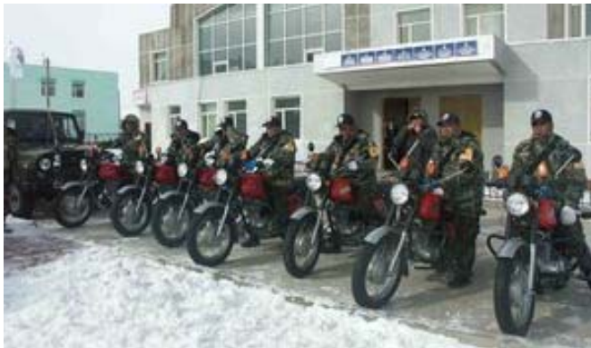
Команда рейнджеров.

расследуются правоохранительными органами.