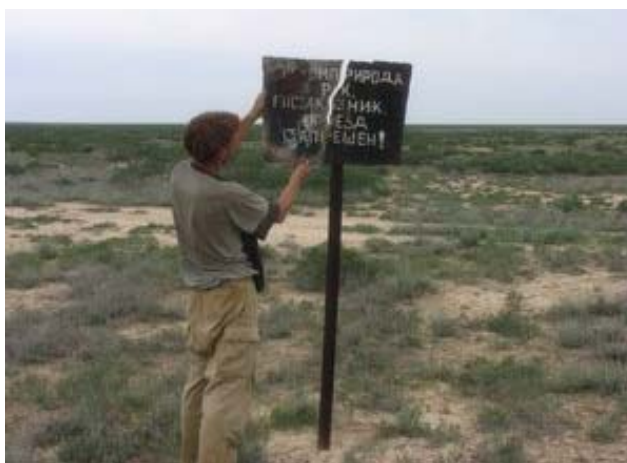
У разбитого аншлага заказника.

Заказник «Сайгачий» был создан в 1991 г. на площади 1 млн. га специально для охраны мест окота сайгака. Данная форма охраняемой территории не работает, поскольку не имеет штата, инфраструктуры, транспорта и т.д. Местные жители, живущие в окрестностях заказника, ничего о нем не знают. Это является причинами, по которым необходимо провести реорганизацию заказника «Сайгачий» в более эффективную форму ОПТ. В апреле 2008 г. Альянс по сохранению сайгака, Институт зоологии АН РУз и Fauna & Flora International при финансовой поддержке Disney Wildlife Foundation и WildInvest начали проект по подготовке обоснования для реорганизации заказника в более строгую форму ОПТ. Проектная команда рассматривает этот проект как первоначальную стадию трансформации «бумажной ОПТ» в реальный активный механизм для территориальной охраны сайгака в Узбекистане