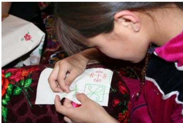
Первые уроки по обучению традиционной вышивке в п. Жаслык.