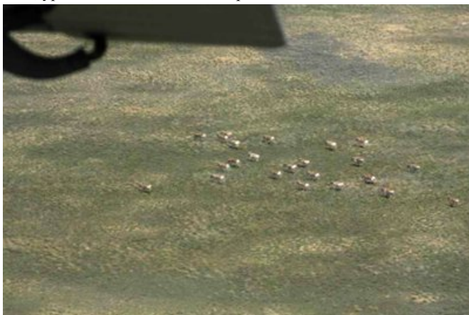
Сайгаки под крылом самолета.

численность сайгака увеличилась на 11,3%, однако для устьуртской популяции отмечено сокращение. В отношении этой популяции по-прежнему остается открытым вопрос – какое количество сайгаков находится в Узбекистане во время учета? Очевидно, в разные годы, в зависимости от погодноклиматических условий это количество животных будет неодинаковым. Для решения вопроса необходимо одновременное проведение учетов сайгака в обеих странах. Для дополнительной информации обращайтесь к Ю.А. Грачеву, Институт зоологии МОН РК, terio@nursat.kz .