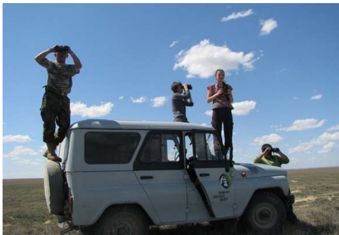
Команда ADCI проводит наблюдения в Бетпакале.

Сохранение сайгака: Инициатива Алтын-Дала создала три группы инспекторов, снабдив их машинами, палатками, биноклями и другим необходимым полевым оборудованием. Они будут поддерживать государственные бригады инспекторов во время полевых работ, собирать данные по ключевым видам для системы мониторинга проекта, а также проводить работу со школьниками и местным авторитетными людьми (традиционным «советом старейшин») с тем, чтобы молодые люди не становились браконьерами.