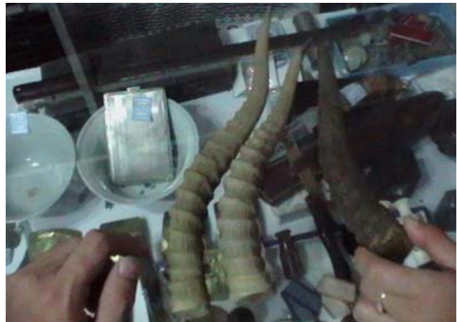
Продажа рогов сайгака на рынке в Китае.