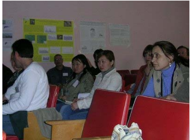
Участники международной школы-семинара.

Для дополнительной информации обращайтесь к Н. Ю. Арыловой, ИПЭЭ РАН, arylova@gmail.com .