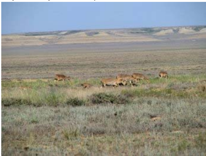
Сайгаки во время отела в Бетпакале.