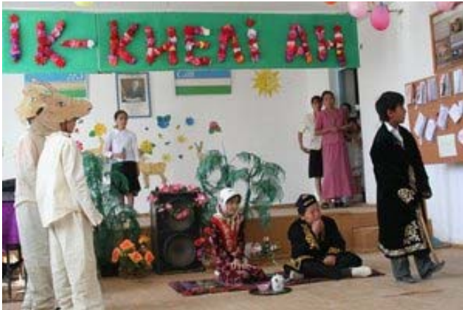
Спектакль о сайгаке в п. Жаслык.

Уже не первый год узбекская команда Альянса по сохранению сайгака при финансовой поддержке WCN проводит обучающую программу для детей Устюрта. В программу по сохранению сайгака активно включились учителя, дети и их родители из трех школ, расположенных в кишлаках с наиболее высоким уровнем браконьерства на сайгака: Жаслык, Каракалпакии. Также мы расширили программу за счет вовлечения школьников из нового для нас поселка Кубла-Устюрт, расположенного в отдаленном малодоступном для посещения районе на восточном чинке плато Устюрт. В марте-апреле этого года в школах были показаны спектакли посвященные сайгаку. Моменту показа предшествовала большая творческая работа детей, педагогов и даже родителей. Дети написали истории посвященные сайгакам: сказки, новеллы, стихи. Самые лучшие из них были выбраны жюри и использованы для создания сценариев