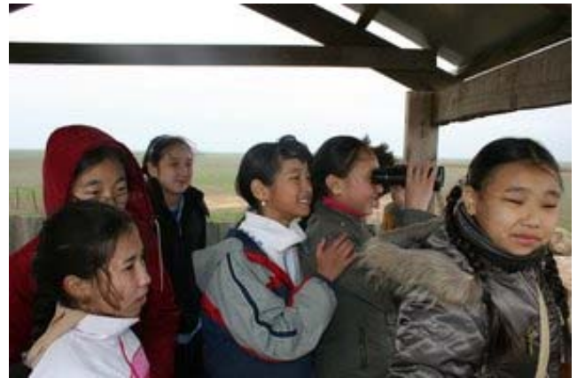
Экскурсия калмыцких школьников в питомник Яшкульский.