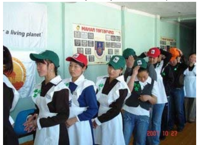
Детский эко-клуб как часть образовательной программы.

В дополнение была начата программа по вовлечению общественности, в том числе создание в местных школах шести эко-клубов. Основное изменение коснулось законодательной базы, и это принесло свои плоды; антибраконьерская команда задержала браконьеров, добывших самку сайгака и трех куланов в ноябре 2007 г., а также одного снежного барса в марте 2008 г. Эти случаи