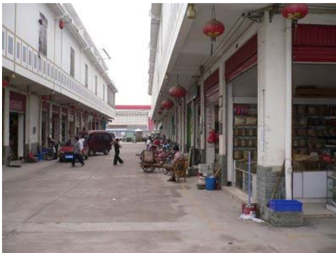
Рынок Традиционной китайской медицины.

Принятие Положения было связано с быстрым сокращением численности панголина и редких видов змей, а также с тем, что «серьезная нехватка рогов сайгака приводит к нехватке ресурсов ТСМ (традиционной китайской медицины) и случаям контрабанды, происходящим время от времени и попадающим в Китай, что привело к проблемам со стороны международного сообщества. СИТЕС и МСОП передали резолюции о сохранении сайгака, требуя усиления управления и выполнения».