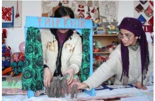
Репетиция кукольного представления в п. Каракалпакия.

Истории, написанные детьми, оказались очень увлекательными и талантливыми, полными глубокого смысла и