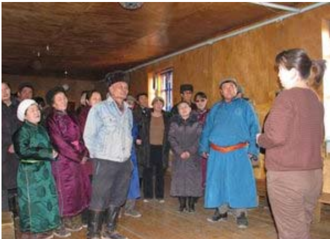
Участие общины пастухов в социологических опросах.

Крупный новый проект WWF-Монголия по сайгаку финансируемый МАВА начался в октябре 2007 г. Он уже достиг определенных успехов, включая проведение обучения инспекторов и местного населения с целью ведения мониторинга, привлечение правительства к подготовке поправок к существующему законодательству по правилам охоты.