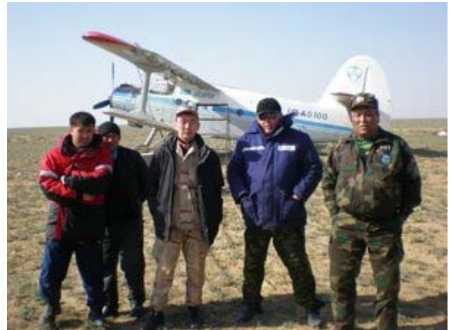
Инспекторы Охотзоопрома на полевом аэродроме в окр. п. Бозой во время учетов устюртской популяции сайгака, весна 2008 г.

Охрана сайгаков осуществляется РГКП «ПО «Охотзоопром» в местах их обитания. Девять мобильных групп, состоящих из 83 инспекторов, работают вахтовым методом, с привлечением 43 единиц автотранспорта повышенной проходимости и 4 спортивных мотоциклов. В охране участвуют также государственные инспекторы областных территориальных управлений лесного и охотничьего хозяйства и сотрудники правоохранительных органов. Мобильные группы оснащены табельным оружием, спутниковыми телефонами, видео- и фотокамерами, мобильными радиостанциями. РГКП «ПО «Охотзоопром» приобретен вертолет «Ми-2», который в настоящее время используется для охраны сайгаков.