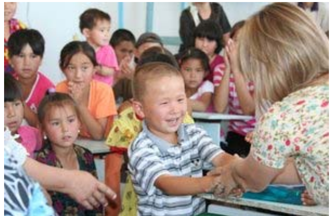
Награждение победителей в п. Кубла-Устюрт.

Для получения дополнительной информации обращайтесь к Е.Быковой и А.Есупову, esipov@sarkor.uz .