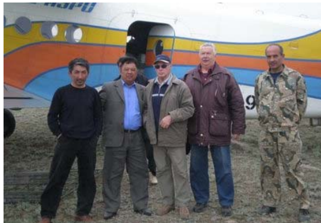
Сотрудники Охотзоопрома и Института зоологии во время учетов Уральской популяции сайгаков.