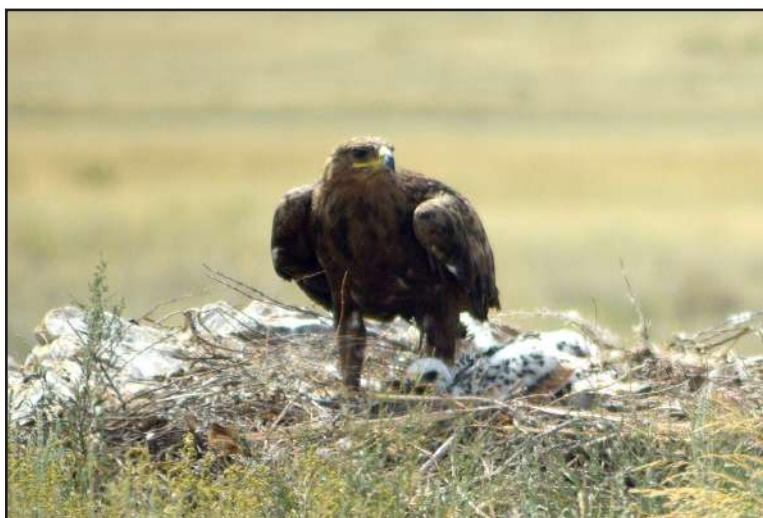
Самка степного орла на гнезде с птенцами.

Currently the main species' resource is situated in Kazakhstan (table 3) and this very country is most of all responsible for saving the Steppe Eagle in the face of the world community. An appeal about the necessity to rise conservation status of the steppe eagle in the Republic of Kazakhstan and the importance of preparation of the national strategy and the plan of actions of saving the Steppe Eagle in Kazakhstan was sent to the Committee on Forestry and Hunting of the Ministry of Environmental Protection of the Republic of Kazakhstan by participants of International Scientific Conference “Eagles of Palearctic: Study and Conservation” in the name of the conference (Outcomes..., 2013). Participants of the XIV International Ornithologists Conference of Northern Eurasia which was held on 18–22 of August, 2015 in Almaty, Kazakhstan, approved propositions to the government of Kazakhstan about the necessity of development of governmental strategy of saving the Steppe Eagle with plans of actions, the necessity of joining the country to the Memorandum of understanding on birds of prey within CMS and asked it as the member of CMS to appeal to Secretariat of Memorandum with the recommendation on development of the plan of action on saving the Steppe Eagle (see Extracts of XIV International Ornithologists Conference Resolution on page 13). But the decision of official establishment of Kazakhstan is still unknown. Taking into account that Kazakhstan is a party of