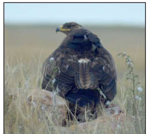
Степной орёл.

In the European Red List on March, 31 2015 the Steppe Eagle's status was officially changes to "Critically Endangered" (CR) (Ashpole et al., 2015; BirdLife International, 2015). Countries of Steppe Eagle's natural habitat according to European Red List are: Albania, Armenia, Azerbaijan, Bulgaria, Georgia, Moldavia, Romania, Russia, Turkey and Ukraine, though it's currently nesting only in Russia and Turkey (there are known flights in Belarus, Croatia, Czech Republic, Denmark, Estonia, Finland, France, Germany, Greece, Hungary, Italy, Netherlands, Norway, Poland, Slovakia, Spain and Sweden). European population of the Steppe Eagle is estimated at 800–1200 breeding pairs or 1600–2400 adults. It's nesting population in Europe decreased by 80 % over more than 49.8 years, which corresponds to 3 generations of eagles (Ashpole et al., 2015; BirdLife International, 2015). Estimates and dynamics of steppe