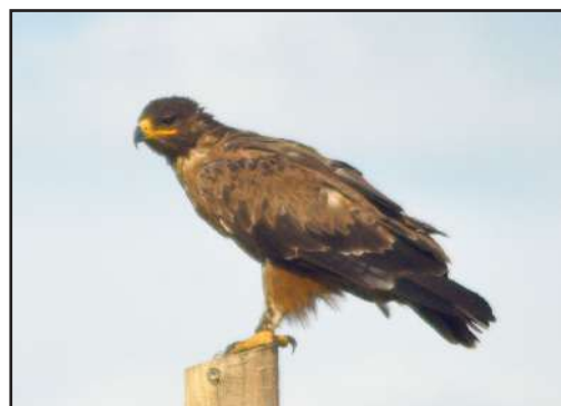
Степной орёл ( Aquila nipalensis ). Steppe Eagle ( Aquila nipalensis ).

The Steppe Eagle ( Aquila nipalensis ) on the most parts of its breeding area is a species closely connected to steppe habitat. Even if it nests on the border of the forest in the forest-steppe or at the upper forest border in mountain forest-steppe, steppe biotopes at the forest periphery are its main hunting grounds. Thus, the condition of its nesting groups well characterizes the condition of steppe ecosystems. That is why the steppe eagle was chosen as an indicator species for evaluating success in realization of the UNDP/GEF/Ministry of Nature of Russia project “Enhancement of