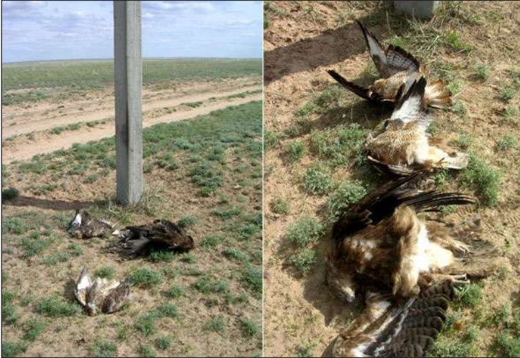
Степной орёл и два ка- нюка, погибшие от пора- жения электротоком в течение дня на одной опоре ПО ЛЭП.

Steppe Eagle and two buzzards, electrocuted on an electric pole during a day.