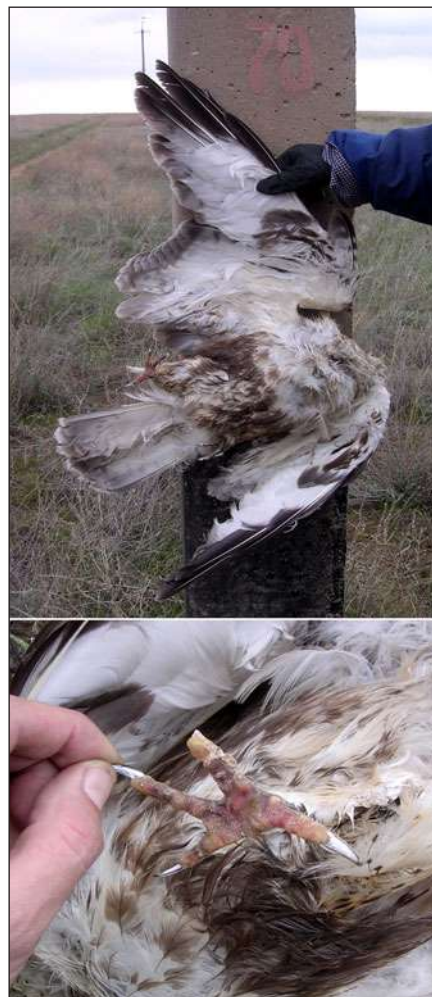
Зимняк ( Buteo lagopus ), погибший от поражения электротоком на ПО ЛЭП (верхнее фото) с характерными следами ожогов на лапах (нижнее фото).

10 km) about 58000 birds of prey are projected to be killed by electrocution every year only during spring migration (8 weeks). And the Steppe Eagles dominate absolutely – about 29000 individuals. 355500 individuals of electrocuted birds of prey are the species listed in the Red Data Book of Kazakhstan for murdering of which are punished by the legislation. However the state nature protection bodies do not undertake any efforts on punishment of owners of “power lines-killers”. We believe the target project on bird protection actions to retrofit existing electric poles-killers should be realized in Kazakhstan at the state level.