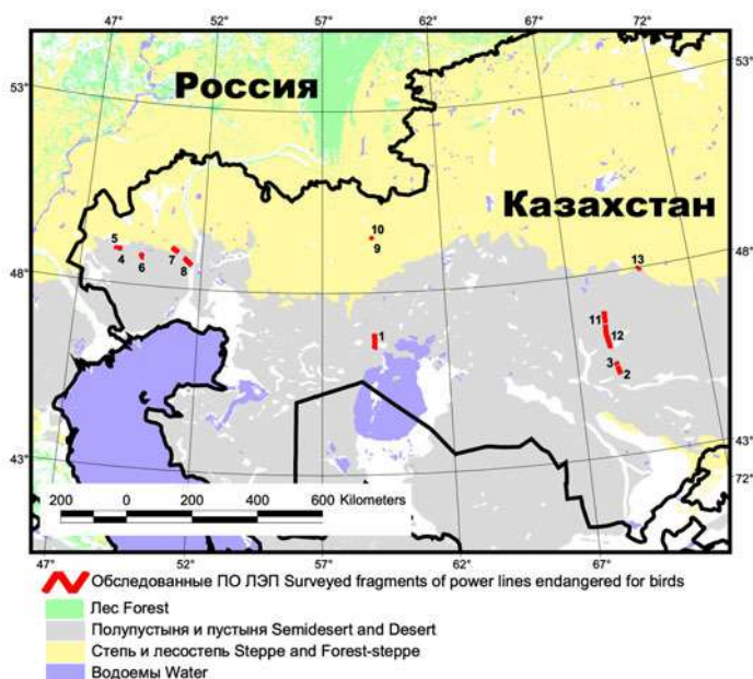
Рис. 1. Обследованные участки птицеподобных ЛЭП в Казахстане в 2003–2007 гг. Нумерация участков на рисунке соответствует нумерации в таблицах 1–3

В условиях интенсификации в Казахстане нефте- и газодобычи и развития инфраструктуры нефте- и газопроводов, а также сопутствующей им инфраструктуры антикоррозионных ЛЭП, была предпринята попытка оценить ущерб, нанесённый как местным, так и мигрирующим хищным птицам птицеподобными ЛЭП (ПО ЛЭП) в нескольких модельных природных районах Западного и Центрального Ка-