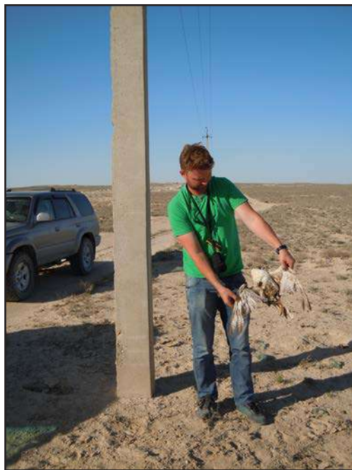
Fig. 6. Saker Falcon, electrocuted at the gas pipeline "Central Asia – Center".

мативными актами РК – Экологическим кодексом Республики Казахстан от 21 января 2010 г. и Законом Республики Казахстан от 9 июля 2004 г. № 593-III «Об охране, воспроизводстве и использовании животного мира». В законодательстве РК нет нормативного акта, который бы предписывал конкретные нормы и правила эксплуатации ВЛЭП, обеспечивающие безопасность птиц. В российском природоохранном законодательстве таким документом является Постановление Правительства РФ от 13 августа 1996 г. № 997 «Об утверждении Требований по предотвращению гибели объектов животного мира при осуществлении производственных процессов, а также при эксплуатации транспортных магистралей, трубопроводов, линий связи