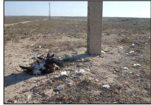
Рис. 5. Степной орёл ( Aquila nipalensis ), погибший на ВЛЭП 6–10 кВ.

Обследование Мангистауской области показало, что на ВЛЭП 6–10 кВ гибнут преимущественно крупные хищные птицы. За весну и осень под опорами таких линий были обнаружены тела и останки 129 птиц, относящихся к 12 видам. По тушкам и по костно-перьевым останкам установлено, что чаще других от удара электрическим током гибнут орлы, составляющие в общей сложности 62,79 % всех погибших птиц (табл. 1). Наиболее многочисленной жертвой является степной орёл ( Aquila nipalensis ), на долю которого приходится 34,94 % от числа определённых до вида птиц. По информации местных зоологов степные орлы ещё недавно гнездились на плато Устурт, располагая гнёзда на старых казахских могилах. В 2013 г. мы не нашли жилых гнёзд этого орла на территории Мангистауской области, но изредка встречали его в период пролёта. Очевидно, что ги-