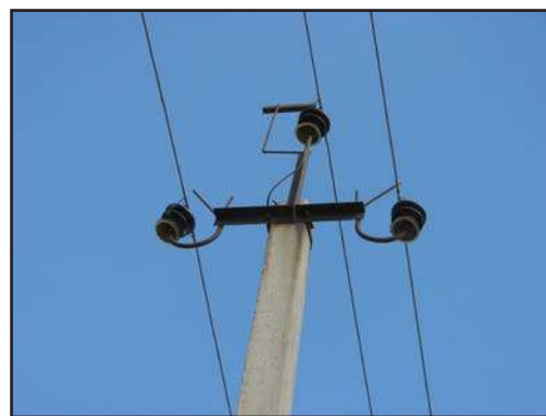
Рис. 4. ВЛЭП с траверсами, оснащёнными «усами» и присадой – наиболее опасные для птиц – получили название «ЛЭП-убийцы».

Распространённым типом ВЛЭП 6–10 кВ является и линия на бетонных опорах с расположенными под углом металличе-