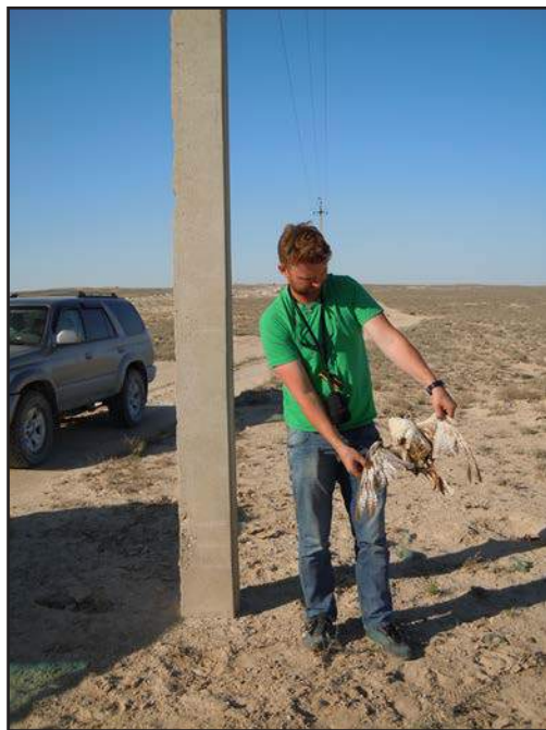
Fig. 6. Saker Falcon, electrocuted at the gas pipeline "Central Asia – Center".

мативными актами РК – Экологическим кодексом Республики Казахстан от 21 января 2010 г. и Законом Республики Казахстан от 9 июля 2004 г. № 593-III «Об охране, воспроизводстве и использовании животного мира». В законодательстве РК нет нормативного акта, который бы предписывал конкретные нормы и правила эксплуатации ВЛЭП, обеспечивающие безопасность птиц. В российском природоохранном законодательстве таким документом является Постановление Правительства РФ от 13 августа 1996 г. № 997 «Об утверждении Требований по предотвращению гибели объектов животного мира при осуществлении производственных процессов, а также при эксплуатации транспортных магистралей, трубопроводов, линий связи