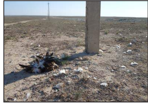
Рис. 5. Степной орёл ( Aquila nipalensis ), погибший на ВЛЭП 6–10 кВ.

Обследование Мангистауской области показало, что на ВЛЭП 6–10 кВ гибнут преимущественно крупные хищные птицы. За весну и осень под опорами таких линий были обнаружены тела и останки 129 птиц, относящихся к 12 видам. По тушкам и по костно-перьевым останкам установлено, что чаще других от удара электрическим током гибнут орлы, составляющие в общей сложности 62,79 % всех погибших птиц (табл. 1). Наиболее многочисленной жертвой является степной орёл ( Aquila nipalensis ), на долю которого приходится 34,94 % от числа определённых до вида птиц. По информации местных зоологов степные орлы ещё недавно гнездились на плато Устурт, располагая гнёзда на старых казахских могилах. В 2013 г. мы не нашли жилых гнёзд этого орла на территории Мангистауской области, но изредка встречали его в период пролёта. Очевидно, что ги-