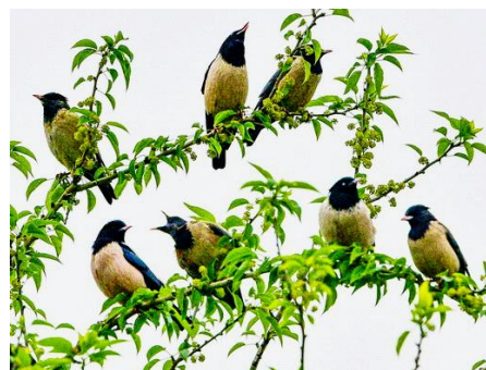
Ахмет Тангрыкулиев