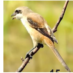
В.Н. Дворянов, фото автора.